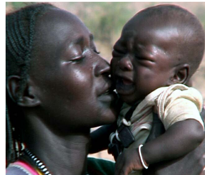
民兵の襲撃を逃れて避難してきたチャドの親子。 スーダン、ダルフルの紛争は、東部チャドに拡大している。