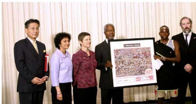
2006年6月、コフィ・アナン国選事務総長(当時)に国際的な武器規制を求める100万人の顔署名を贈呈

〒169-0073 東京都新宿区百人町 1-6-15 ヤナギヤビル 3F TEL: 03-6379-5022 FAX: 03-6379-5023